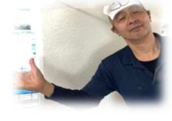
また1年 頑張りましょう！ むらまつコーチです☆