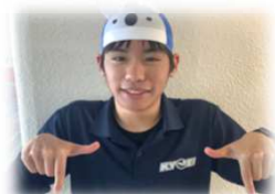
スポーツ観戦大好き！ 2年目の かなざわコーチです☆