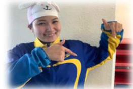
一緒にプールを 楽しみましょう！ おおげきコーチです☆