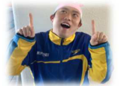
目指せ！ シックスパック！！ なかむらコーチです☆