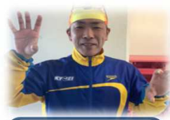
みんなで楽しく 練習しましょう！ いのうえコーチです☆