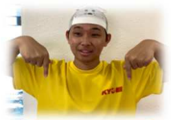
野球大好き！ 2年目の たくコーチです☆