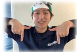
ディズニー大好き！ いまむらコーチです☆